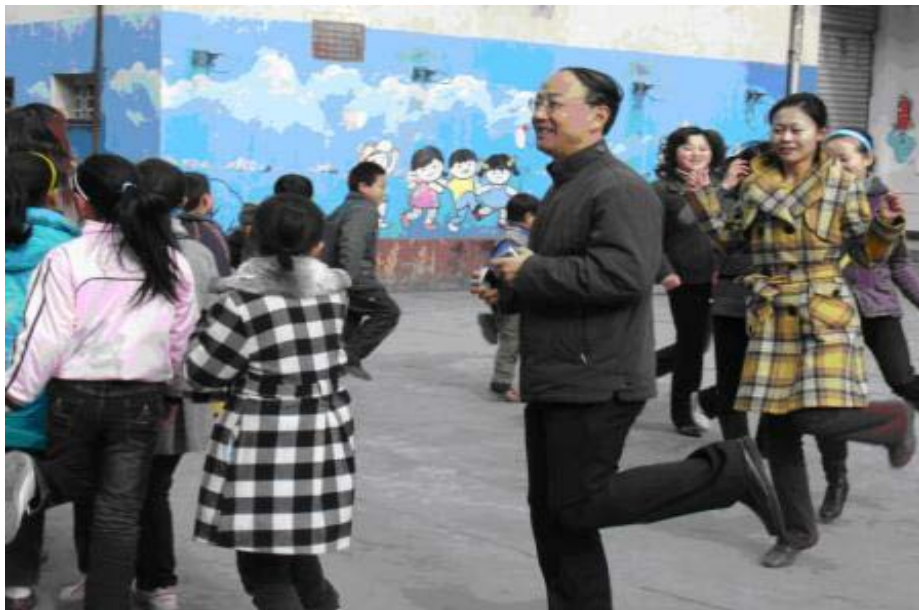
史教授与大家一起跳“兔子舞”