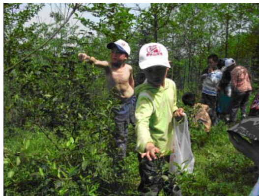
图中打着赤膊的是伤残儿童

目的地到了，志愿者阿姨又给孩子们讲解怎样摘茶，看到山上茶坪茶树上冒着那么多的嫩芽，大家迫不及待想去尝试摘茶，老师和孩子一起感受着摘茶的喜悦，孩子们个个脸上洋溢着喜悦的笑容。