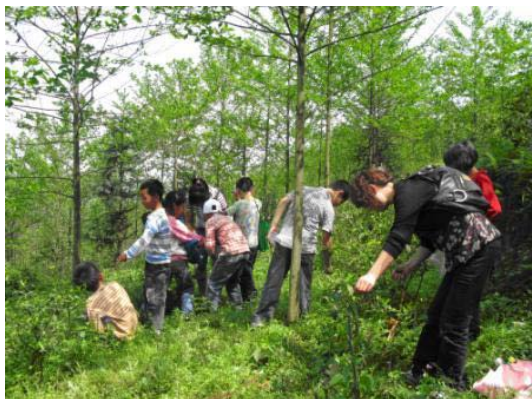
家园老师带领大家摘茶

今天天气不错，阳光明媚，什邡市红白镇儿童友好家园的工作人员组织小朋友到柿子坪村去和柿子坪村的孩子一起开展采茶活动，柿子坪村的一位伤残儿童也参加了这次活动。孩子们个个是有备而来，各自戴着帽子，带着矿泉水和装茶叶的口袋。为了安全起见，我们租车来到山脚下，孩子们从山脚下一路高高兴兴地唱着歌上山，途中一位志愿者阿姨还教孩子们认识山上的野菜。