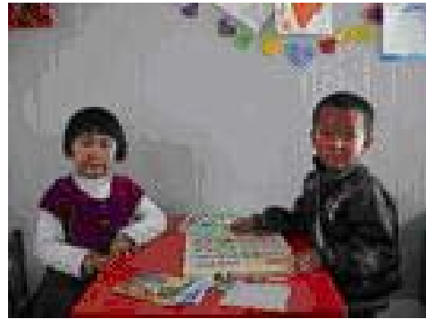
在家园工作人员的悉心开导下，小蒲开始愿意和其他孩子一起玩了