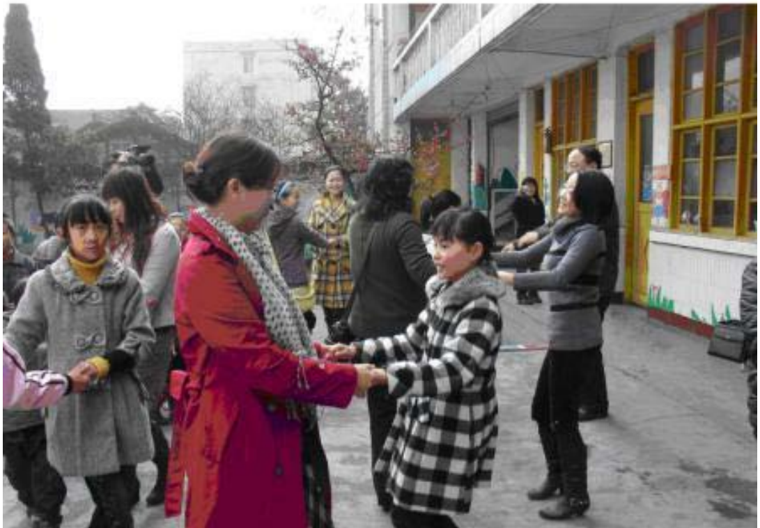
大家一起来跳“友谊舞”

2009年3月14日，中国青年政治学院史柏年教授一行4人前来天全县儿童友好家园提供专业支持。史教授与我县妇联有关工作人员及儿童友好家园的工作人员一同参加了由来园孩子们组成的“大家一起来跳舞”的大型户外活动。随着音乐响起，大家两人一组，在欢快的旋律中跳起了第一支“友谊舞”，你退退，我进进，你拍手，我拍手，优美的舞步，愉悦的心情，呈现在每一个人的身上。接着，大家排着长队，一个接一个，跳起了欢快而又富有节奏感的“兔子舞”，“前前后后、左左右右、蹦蹦跳跳……”哼着歌曲，跳着舞蹈，大家情不自禁地沉醉在这美妙的旋律中，灿烂的笑容绽放在每一个人的脸上。最后大家围成一个大圈，一个拉着一个，在优美的旋律中划动着轻轻的舞步，结束了今天的活动。每个人都意犹未尽，还沉醉在这欢快而祥和的气氛中。在家园里，孩子们不仅愉悦了身心，还陶冶了情操，学了很多知识，相信在家园的每一天，孩子都能够感受到这份快乐！