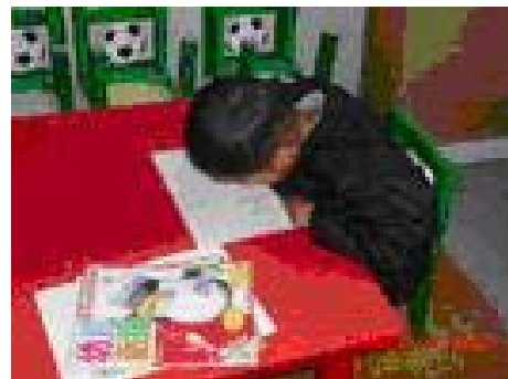
刚来家园时，小蒲总是独自一人躲在角落里玩